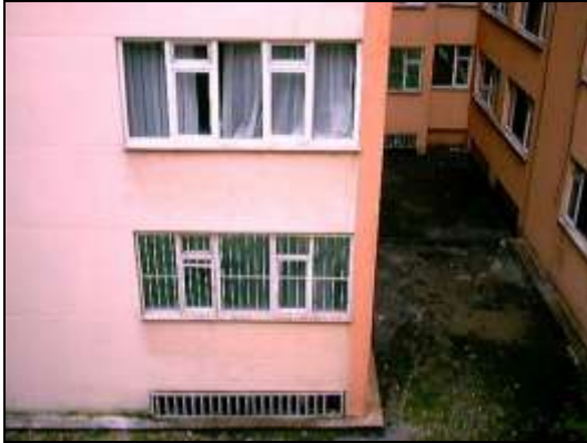
Şekil 3 – Binanın Diğer Bloklarla Bağlantısı

Pas payında yapılan işçilik hatalarının, Cerrahpaşa Eğitim Hastanesi binası A3 bloğunda oluşturduğu sorunlar, “Bakırköy İlçesi Zemin Yapı Etkileşimine Bağlı Risk Analizi” projesi kapsamında incelenen binaların birçoğunda benzerlik göstermiştir.