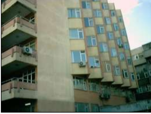
Şekil 2 – Binada Bulunan Çıkmalar

Raporlardan anlaşıldığı gibi, binanın uygun yerlerine perde duvar yapılması sonucu bina, taban kesme kuvvetini emniyetle taşıyabilmektedir. DURTES programı sadece bir kısım etkileri dikkate alır. Binanın mutlaka daha ayrıntılı bir analizinin de yapılması gerekmektedir.