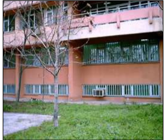
Şekil 1 – Bodrum Kat Dış Duvarları

temeldir. Bodrum dış duvarları çoğunlukla betonarme perde olup sadece zemin etkilerini taşımaktadır. Bu da binanın dış kolonlarının çoğunda kısa kolon etkisi yaratmaktadır (Şekil 1). Bodrum kattaki kirişlerin genişliği, kolonların genişliğine eşit olup, üst katlara çıkıldıkça kolon kesitlerinin azalması ve kiriş kesitlerinin sabit kalması sebebiyle güçlü kiriş-zayıf kolon problemi oluşmaktadır.