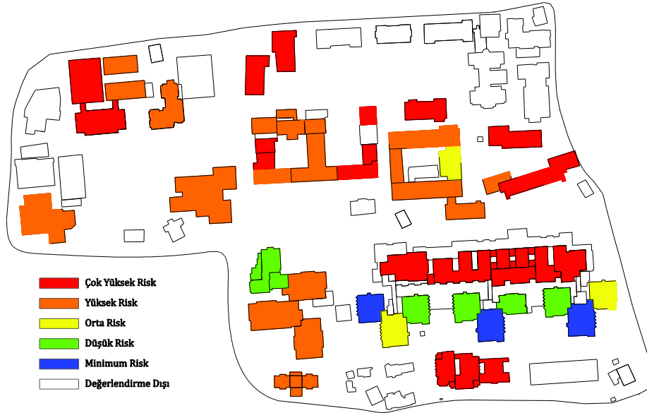
Şekil 3. İÜ Cerrahpaşa Yerleşkesi'nde yer alan binaların risk haritası